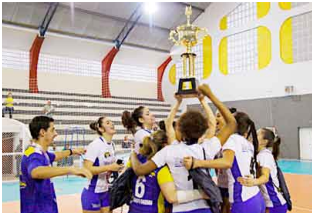
A decisão veio após a final do vôlei feminino sub-21, em que São José dos Campos venceu Taubaté por 3 sets a 0

A delegação joseense foi composta por 46 equipes. São 406 atletas (218 homens e 188 mulheres) nas 22 modalidades oficiais e 40 atletas nas três modalidades extras (futebol de mesa, rugby e jiu jitsu).