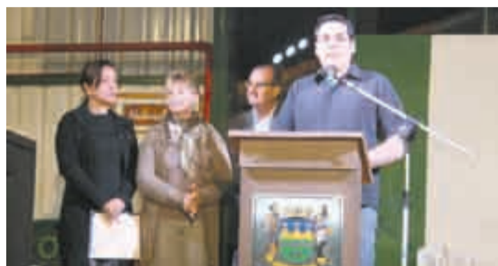
O evento tem o apoio da Prefeitura de Taubaté